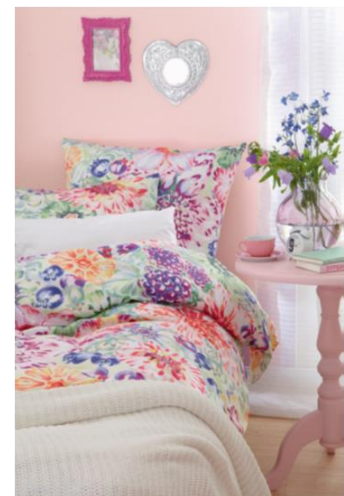
Stress lass' nach: Mit dem sanften Rosé-Ton „Mandelblüte“ der Alpina-Farbrezepte verströmt der Raum gleich eine einladende Gemütlichkeit und eine fröhliche Unbeschwertheit.

Farben beeinflussen unser Unterbewusstsein. Mit diesem Wissen kann man sich selbst sanft manipulieren. Und das gilt nicht nur für farbige Kleidung an einem trüben Tag. Mit gezielt eingesetzten Nuancen an der Wand lassen sich ganz wunderbar Stimmungen kreieren. Für besagte Morgenmuffel empfehlen die Farbexperten von Alpina, generell auf fröhliche Töne im Schlafzimmer zu setzen. So kann das kräftige Gelb „Sommerzeit“ der Alpina-Farbrezepte „chronisch müden“ Menschen sogar beim