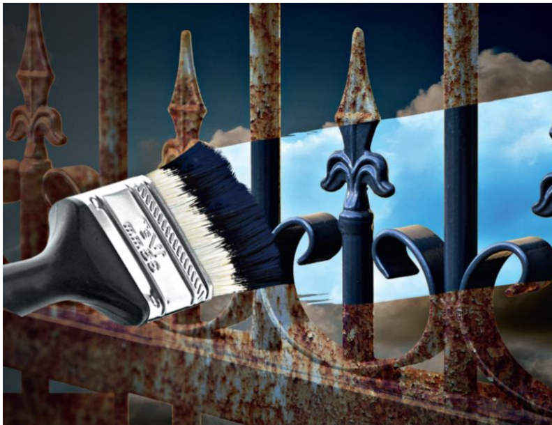
Mit hochwirksamen Anti-Rost Metallschutz-Lacken leistet Alpina einen entscheidenden Beitrag für den Werterhalt von Metallobjekten rund ums Haus.

Ober-Ramstadt, Februar 2017 – (epr) Ein gepflegter Außenbereich gilt seit jeher als die Visitenkarte eines gemütlichen und stilvollen Zuhauses – dekorative Gegenstände aus Metall wie schmiedeeiserne Geländer oder Zäune setzen dabei im Garten attraktive Statements. Ob die gusseiserne Gartenbank, das viktorianische Gewächshaus oder der klassische Schmiedezaun: Vor allem die englische Gartenkultur hat die Verwendung von metallenen Accessoires geprägt, die auch bei der modernen Gartengestaltung hierzulande nicht mehr wegzudenken sind.