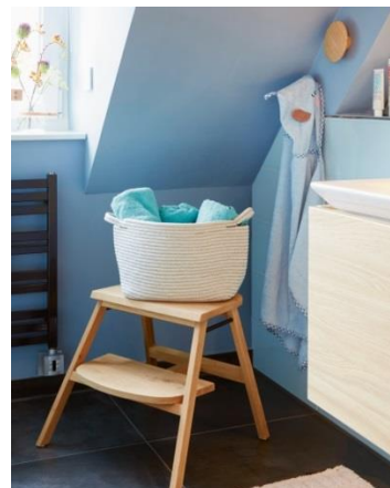
Im gesamten Wohnraum wird viel Wert auf ansprechendes Design und individuelle Farbkonzepte gelegt – so auch im Badezimmer, etwa mit dem Graublau „Ruhe des Nordens“ von Alpina Feine Farbe.