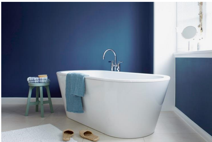
Die Farbkollektionen Alpina Feine Farben und Alpina Farbrezepte liefern viele Inspirationen für das ganz persönliche Traumbad. Wie wäre es zum Beispiel mit dem Ton „Blaue Stunde“ von Alpina Feine Farben?

Ober-Ramstadt, Januar 2019 (epr) Die Wandfarbe kann sich positiv auf die Stimmung auswirken: Ob Konzentration im Arbeitszimmer, Dynamik im Wohnzimmer oder Erholung im Schlafzimmer – die richtigen Nuancen regen den Geist an oder wirken beruhigend. Auch aus dem Badezimmer kann dank großer Vielfalt an Wandfarben und einem damit verbundenen Konzept ein ganz persönlicher Wohlfühlort geschaffen werden.