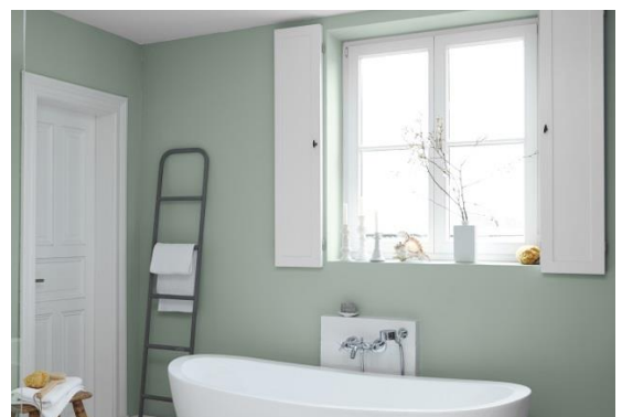
Mit einer harmonischen Kombination aus Grüntönen wie „Sanfter Morgentau“ von Alpina Feine Farben, rauem Holz, weißen Akzenten und Accessoires aus Glas lässt sich eine individuelle Wellness-Oase erschaffen.