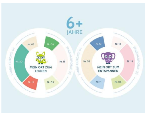
Die Alpina Farbkollektion Farbenfreunde wurde speziell für das Kinderzimmer entwickelt. Aus 24 verschiedenen Farbtönen kann genau die Farbe gewählt werden, die sich an den Bedürfnissen des Kindes orientiert.