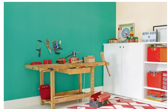
Bestens für die Arbeitsecke geeignet: Grüntöne mit blauen oder gelben Nuancen wie Drachen-, Frosch- oder Raupengrün regen die Kreativität der Kleinen an und unterstützen die Denkprozesse.