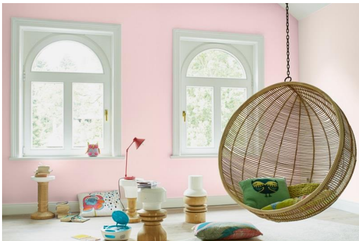
Ein absolutes Mädchenraum! Zarte Rosatöne wie Einhorn- oder Flamingorosa wirken entspannend und bringen zusätzlich ein Gefühl von Sicherheit mit.

Ober-Ramstadt, Oktober 2018 (epr) Mit dem Überreichen der Schultüte beginnt für die Kleinen ein neuer wichtiger Lebensabschnitt. Neben den Ecken zum Ausruhen und Spielen braucht das Kinderzimmer nun auch Bereiche zum Lernen und Konzentrieren. Das Bällebad muss dem Schreibtisch weichen und auch ein kleines Bücherregal findet seinen Platz. Doch nicht nur auf die passende Einrichtung kommt es an, auch die richtige Wandfarbe kann das Schulkind in mehrfacher Hinsicht unterstützen.