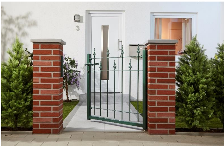
Der lackierte Zaun lässt nicht nur sich, sondern auch die ganze Umgebung neu erstrahlen.

Ober-Ramstadt, Januar 2018 (epr) Der Garten ist schon lange kein verwildertes Stückchen Grün hinter dem Haus mehr. Auch draußen soll es gemütlich sein – dort wollen wir uns mindestens genauso wohlfühlen wie in unserem Wohnzimmer. Moderne Sofalandschaften und formschöne Stilelemente wie Mauern, Podeste und Wasserbecken werden immer wichtiger für den wohnlichen Charakter im Garten. Unterstützt wird dieser durch die Verwendung edler Materialien wie Metall. Der beliebte Werkstoff kommt unter anderem für Zäune, Beeteinfassungen oder auch Gartenmöbel zum Einsatz.