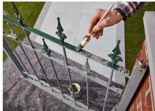
Bevor man mit dem Lackieren beginnt, sollte man etwas Malervlies unter den Zaun legen, um den Boden zu schützen.