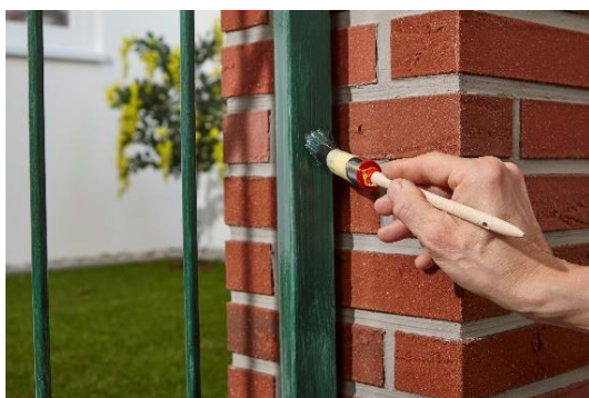
Wenig Aufwand, große Wirkung: Der Anti-Rost Metallschutz-Lack wird in nur zwei Arbeitsgängen auf den Rost aufgetragen.